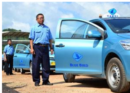
Blue Bird taxi's.

U kunt deze taxi's ook vinden op speciale taxi standplaatsen of gewoon aanhouden langs de kant van de weg. De lamp bovenop de taxi brandt als hij al iemand vervoert. Als richtlijn geldt dat bij de start van uw reis de meter begint met Rp 7,000 (€ 0,43) en omhoog klimt met Rp 3,600 (€ 0,23) voor elke 1/10 van een kilometer; wilt u de taxi op u laten wachten dan kost dat is Rp 42,000/uur (€ 2,63) per uur. Voor eventuele dagtrips vanuit uw guesthouse te Sanur is vervoer (auto of minibus) al inbegrepen in de prijs.